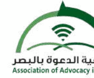
جمعية الدعوة بالبصر